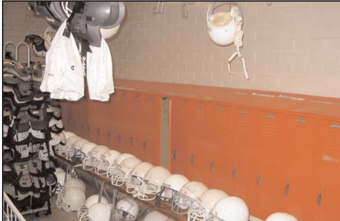
Reparación y renovación en la Escuela Media Dobie

ada y completa calidad de programas en la escuela. En iniciativa única que se está llevando a cabo, llamada Kaleidoscope (Caleidoscopio), los estudiantes crearán un parque al cruzar la calle enfrente de la escuela y pintarán grandes murales tanto en el plantel como fuera de él. El parque es un enorme proyecto de ajardinamiento que se tomará varios años para terminar. Con el tiempo, el parque de Dobie incluirá un salón de clases al aire libre, un huerto, pantano, flores silvestres y mucho más. [Include pictures of park/projects, available on the school website in an old newsletter.] El proyecto de murales, llamado Colores Kaleidoscope, exhibirá arte realizado por los estudiantes en salones de clases, pasillos, oficinas, áreas exteriores del edificio, y posiblemente en la comunidad local. Esta iniciativa de Kaleidoscope incluye los esfuerzos de todos los estudiantes que deseen partici-