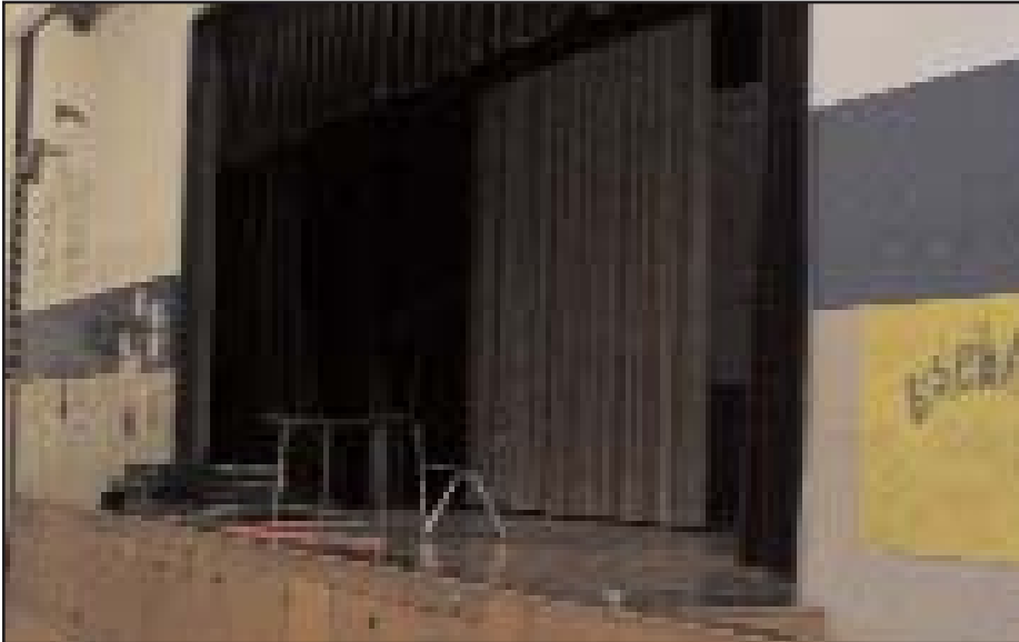
Reparación y renovación en la Escuela Media Martin

Esta edición de Fundamentos abarca las escuelas secundarias Johnston y Lanier, incluyendo sus escuelas tributarias primarias y medias.