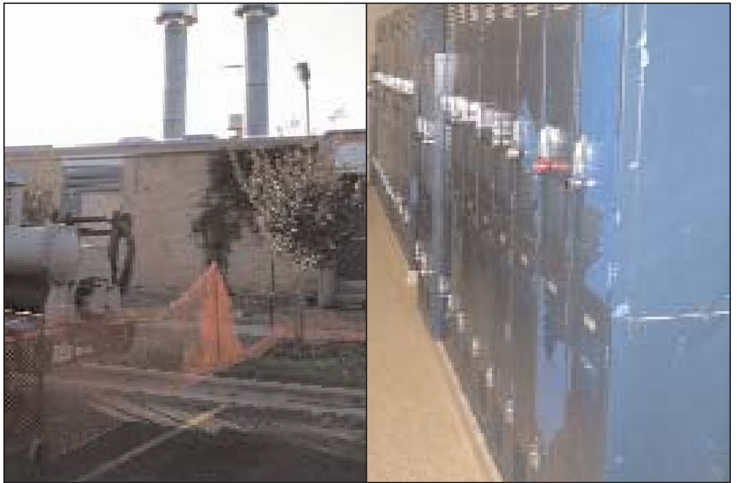
Reparación y renovación en la Escuela Media Martin

Para un listado completo de todos los proyectos de bonos de Nuestra Manana en Acción de 2004 indicados por escuela, sírvase ir al sitio del Internet www.theappleatwork.com , o llamar al 414-BOND.