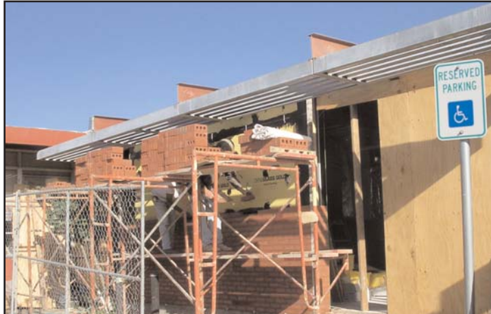
Repair and renovation at St. Elmo Elementary

diferencia en la Escuela Secundaria Travis. En esta escuela se harán amplias renovaciones, incluyendo la construcción de tres salones de ciencias adicionales, así como la renovación de otros salones de ciencias. El teatro de Travis se ampliará a una capacidad de 490 personas, con escenario y área de proscenio. Otros proyectos en Travis incluyen el reemplazo del sistema HVAC; techo nuevo en las alas 200, 300 y 400; instalación de aparatos de seguridad; restauraciones de los baños; mejoras ADA; y ventanas nuevas y operables. Todo el trabajo se iniciará a finales de noviembre 2005, y se espera completar la mayoría de los proyectos para principios del siguiente año escolar. (El teatro está programado para terminarse durante el otoño 2006.) Todos los proyectos incluirán componentes del programa de Edificación Verde.