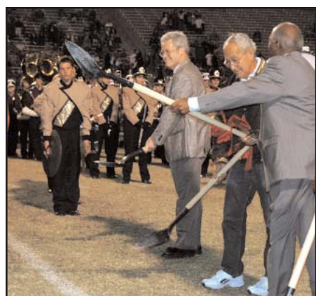
Inicio de la construcción de instalaciones atléticas en el Burger Center