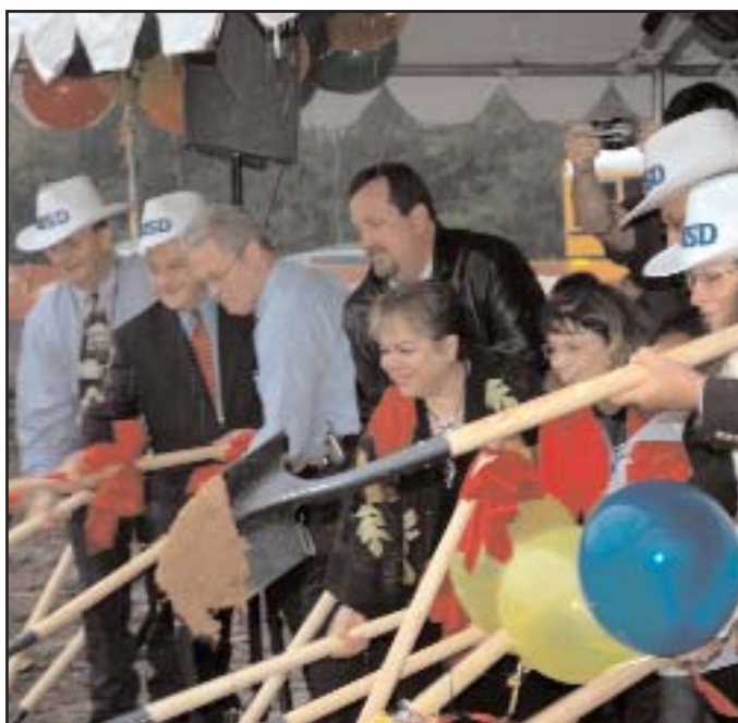
Inicio de la construcción de la nueva Escuela Primaria al Sureste

La Mesa Directiva de Austin ISD invita a la comunidad a someter nombres para las dos escuelas, las cuales se abrirán en otoño 2006. El Comité Gubernativo de la Mesa Directiva [Board of Governance Committee] determinará un proceso de selección y presentará sus recomendaciones a la Mesa Directiva entera para discusión en enero.