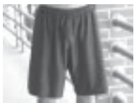
Pantalones cortos atléticos fuera de PE

Abajo hay ejemplos de ropa inapropiada. Las escuelas individuales pueden adoptar requisitos adicionales.