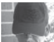
Sombreros o gorras en el interior (exceptuando artículos religiosos)