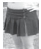
Faldas cortas que distraen