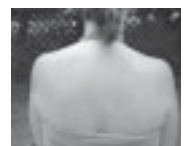
Corpiño-blusa con broche al cuello