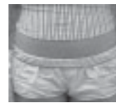
Torsos al descubierto