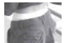
Ropa interior visible