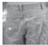
Pantalones demasiado holgados