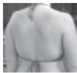
Blusas sin espalda